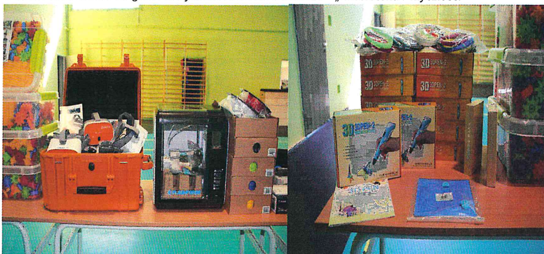
Drukarka 3D, Gogle Wirtualnej Rzeczywistości, Zestaw długopisów/penów 3d z akcesoriami

Szkoła Podstawowa im. gen. Władysława Andersa w Nowem – „Laboratoria Przyszłości”