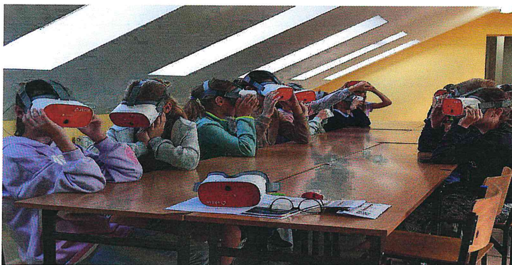
Gogle Wirtualnej Rzeczywistości