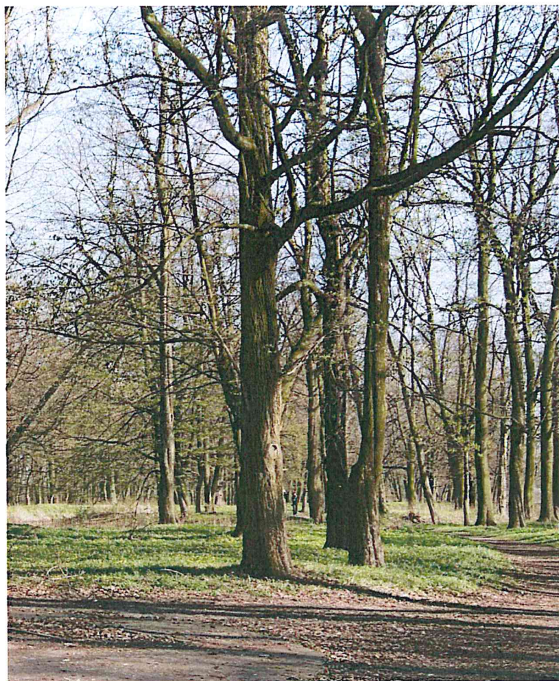
Park w Krośniewicach