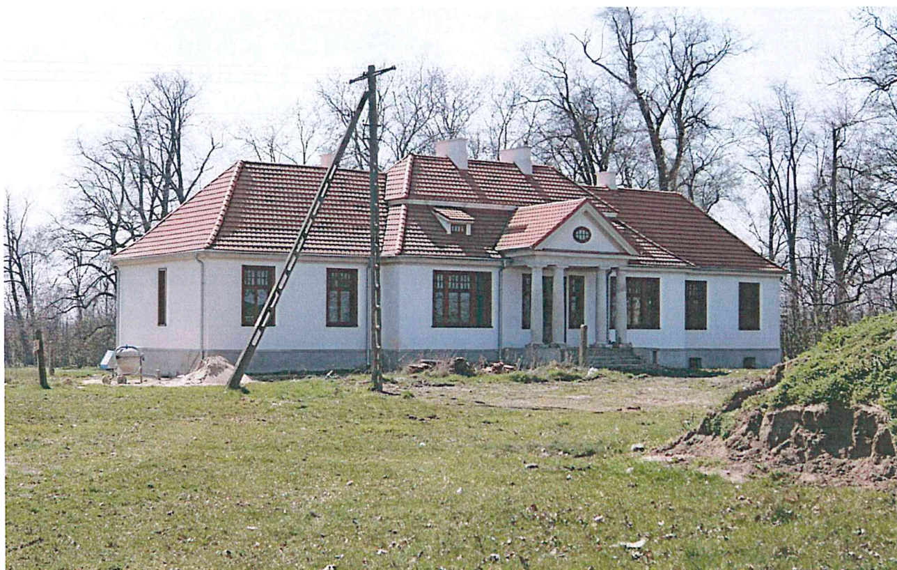
Remonty obiektów zabytkowych

Miasto i Gmina Krośniewice dokona wszelkich starań, by doprowadzić do poprawy stanu obiektów zamieszczanych w gminnej ewidencji zabytków. Istnieje jednak bariera natury prawnej na drodze pozyskiwania środków finansowych na przeprowadzenie remontów, ponieważ ustawa stanowi, że finansowane są prace remontowe obiektów wpisanych do rejestru. Obiekty nie objęte prawną formą ochrony tzw. ewidencjonowane mogą uzyskać dofinansowanie jedynie w przypadku opracowania projektów kompleksowej odnowy ze środków dysponowanych przez Urząd Marszałkowski w Łodzi np. zagospodarowanie turystyczne kolejki wąskotorowej, powrót do tradycji szlacheckich dawnych dworów, ochrona tradycyjnego rzemiosła - młynarstwa, których celem jest wzmocnienie więzi i tożsamości lokalnej, poprzez wykorzystanie walorów turystycznych i kulturowych Miasta i gminy Krośniewice. Miasto i Gmina Krośniewice systematycznie znakuje cenne obiekty zabytkowe.