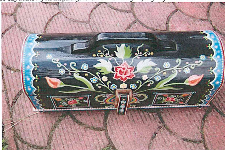
Skrzynia ludowa – pamiątka regionalna

Należy poszukiwać inspiracji tworzenia lokalnych pamiątek np. wagoniki kolejki wąskotorowej z terenu Miasta i Gminy Krośnice lub szydełkowych inspiracji twórców ludowych, czy wyrobów kowalstwa artystycznego.